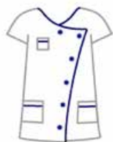
Responsable du service

Ce personnel est à votre disposition mais non à votre service, nous vous remercions d'y penser.