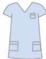
Personnel du Bloc opératoire