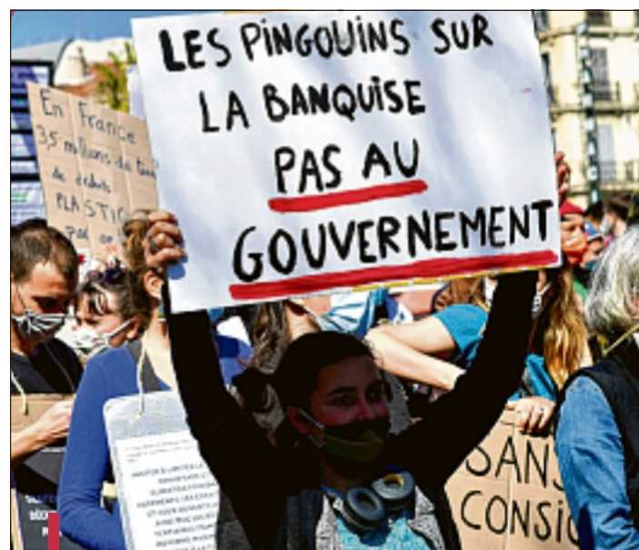
Le 28 mars dernier, lors d'un rassemblement à Marseille.

Après les rassemblements des 19 et 28 mars derniers, un nouvel appel à la mobilisation a été lancé pour dimanche prochain. A Aix, rendez-vous a été donné à la Rotonde à 14 h 30 pour exiger une "vraie loi climat" et "une vraie transition écologique et sociale". "Malgré l'avis des scientifiques, malgré la reconnaissance juridique de la responsabilité de l'Etat français dans la crise climatique par le tribunal administratif de Paris le 3 février 2021, malgré la Convention citoyenne et les mobilisations, le gouvernement ne fait rien pour respecter ses engagements", dénonce un collectif d'associations déterminé à "changer ce système" malgré le